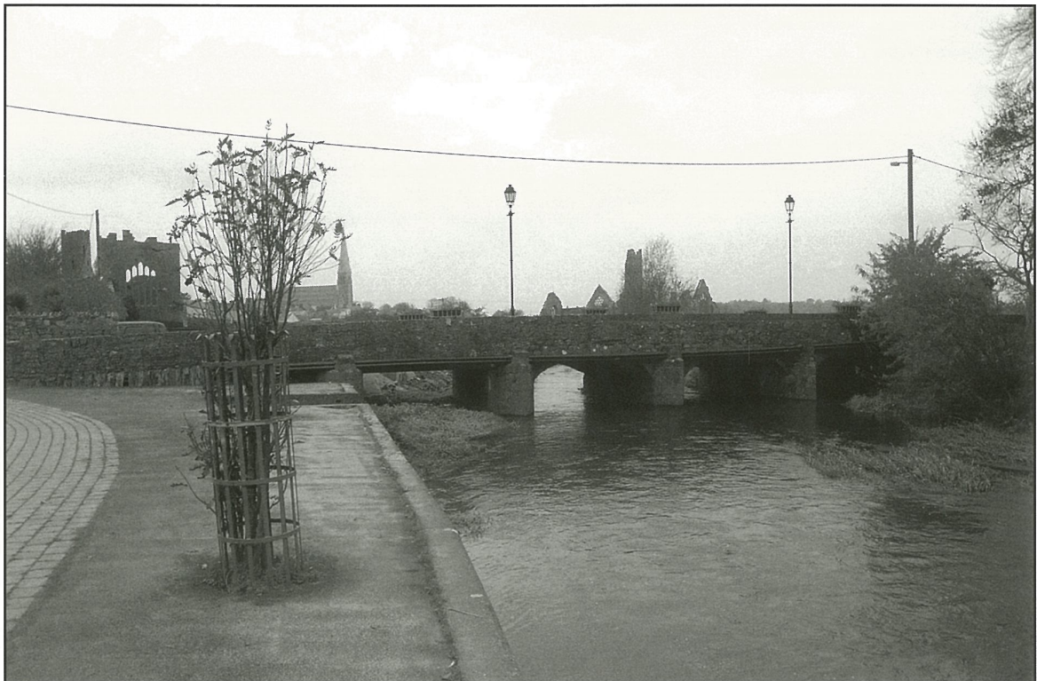
Nua: 2004 AD