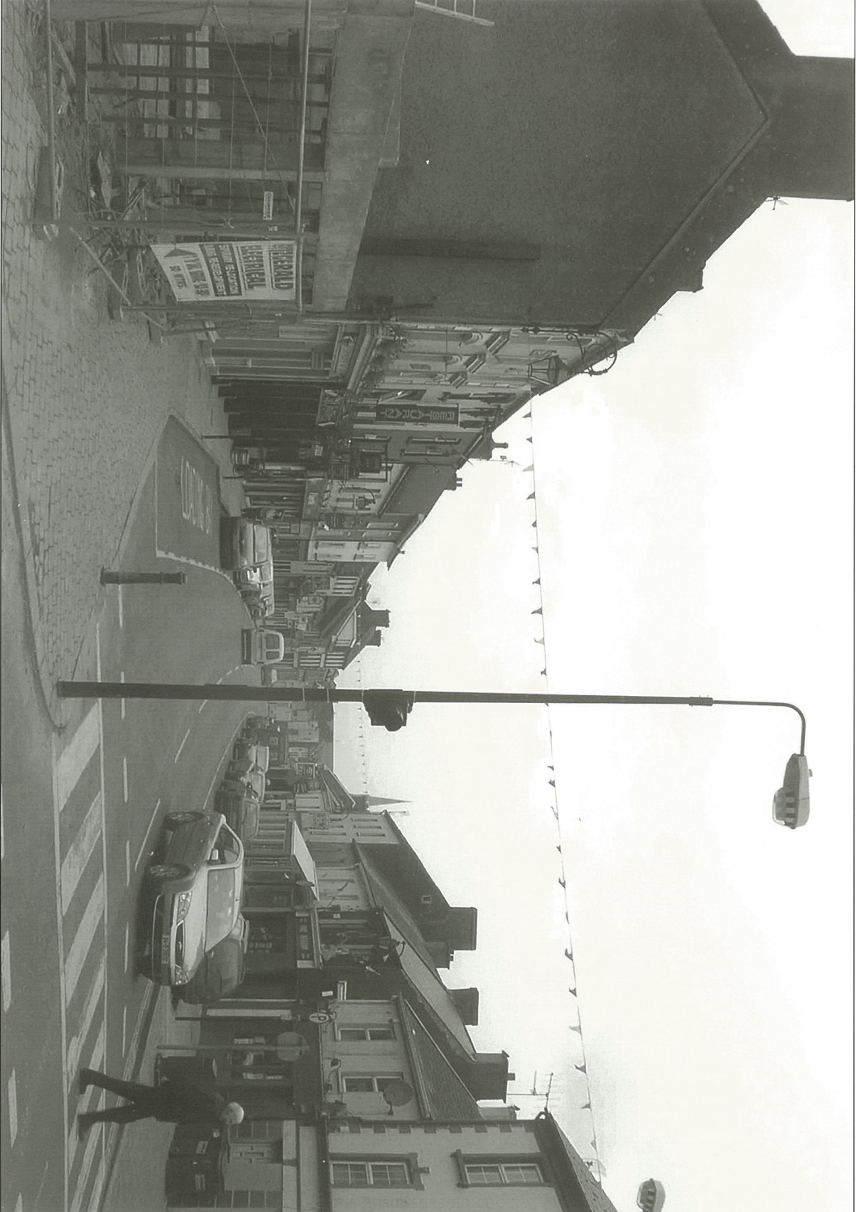
Sráid an tSáirséalainn, Cill Mocheallóg, Contae Luimnigh, 2004.