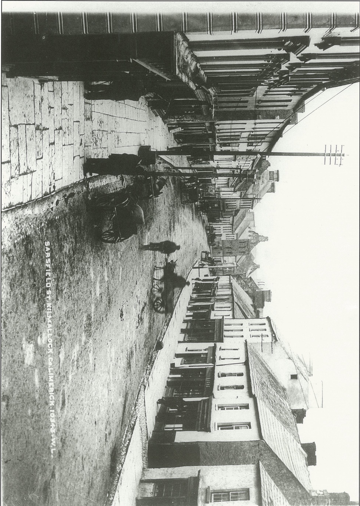
Sráid an tSáirséalaiġh, Cill Mocheallóg, Contae Luimnigh, thart ar chéad bliain ó shin.