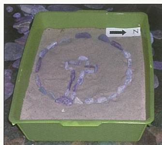
Tuama Pasáiste i dtráidire