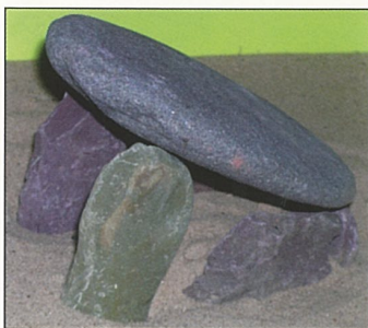
Tuama Ursnach i dtráidire